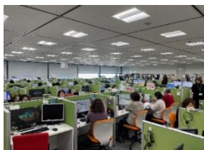
笑顔の絶えないフロア（100席）