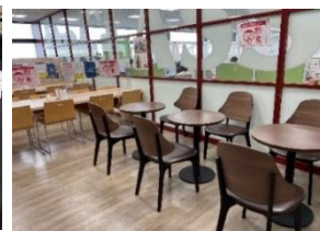
カフェのような休憩室も完備