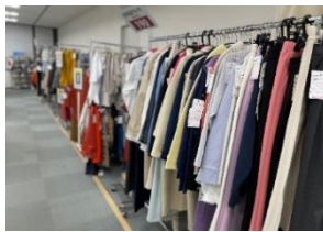
新作サンプルコーナー